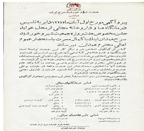
شکل ۱۴. فهرست پزشکان و داروخانه‌های مجانی جمعیت شیر و خورشید همدان برای ارائه خدمات پزشکی و درمانی به مستمندان و افراد بی‌بضاعت ۱۳۲۷