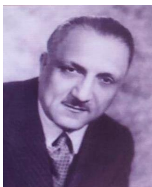
شکل ۴. شادروان علیرضا قراگوزلو ملقب به بهاء‌الملک واقف درمانگاه خیریه بهاء‌الملک همدان

یاد کرده است. بهاء‌الملک قراگوزلو که یکی از رجال دانشمند و وطن‌خواه و مورد علاقه ملت است، از همدان وارد تهران شد. در دوره چهارم مجلس ملی، بهاء‌الملک (سوم) یکی از دو نماینده همدان بود و در کابینه مستوفی الممالک (حوت ۱۳۰۱ش/۱۳۴۱ق) به وزارت مالیه برگزیده شد. سپس (در ۱۳۰۲) ریاست هیئت نظارت بانک ملی را یافت و چون زیر بار تحمیلات نرفت از آن مقام استعفا کرد. اصولاً در عهد پهلوی اول قبول منصب و مقام نکرد تا آنکه در کابینه قوام السلطنه (۱۳۲۵) وزیر دادگستری شد. بهاء‌الملک به تاریخ ۱۹ خرداد ۱۳۳۳ در هفتاد سالگی در تهران در گذشت. پیکرش را به همدان آورده در (باغ اعتمادیه) به خاک سپردند [۹].