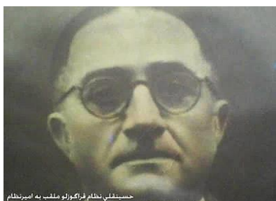
شکل ۳. شادروان حسینقلی نظام قراگوزلو ملقب به امیرنظام واقف موقوفه امیرنظام کیودرآهنگ

امیرنظام قراگوزلو ملقب به امیرنظام دوم در سال ۱۲۶۱ در شهر همدان به دنیا آمد. در زمان نخست‌وزیری ناصرالملک به حکومت استان کرمانشاه منصوب شد. در زمان نخست‌وزیری فتح‌الله سپهدار رشتی، به وزارت جنگ منصوب شد و توانست در دو دوره نخست‌وزیری سپهدار رشتی این سمت را حفظ نماید. وی سپس به حکومت همدان منصوب شد. در زمان حکومت رضاخان، مدتی ریاست تشریفات سلطنتی کاخ شاه پهلوی را به عهده داشت. سپس در سال ۱۳۱۸ به اروپا رفت و مدتی نیز مستشار افتخاری سفارت ایران در پاریس شد. امیرنظام قراگوزلو در سال ۱۳۳۱ و سن ۷۰ سالگی، در کشور فرانسه از دنیا رفت. حسینقلی قراگوزلو یکی از ملاکین و سرمایه‌داران بزرگ زمان خود بود. وی قبل از وفاتش حدود ۵۴ پارچه آبادی را وقف امور خیریه کرد تا منحصراً به مصرف ساختن بیمارستان و مدرسه برسد، ولی بر اثر ظهور مدعیان و مداخله دیگران، دو ثلث آنها به وراثت صغار تعلق یافت. امیرنظام هنگام مرگ ۴۸ میلیون تومان پول نقد و مقادیر زیادی سکه و جواهر و فرش داشت که معلوم نشد چه کسی آن‌ها را تصرف نمود [۱۵]. (شکل ۳).