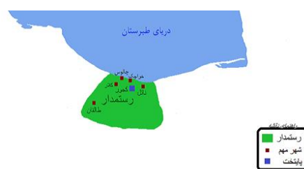
شکل ۲: حدود جغرافیایی ناتل

باستان‌شناسان با حفاری در این منطقه معتقدند که با وقوع سیلابی عظیم، این شهر به زیر ۳ تا ۴ متر رسوبات مدفون شده است. در طی این تحقیقات ارگی از دل زمین کشف شد که قدمت ۲۵۰۰ ساله داشته که نشان از تاریخ و پیشینه تاریخی این شهر قدیمی دارد (شکل ۳) [۱۱].