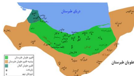
شکل ۱: حدود جغرافیایی طبرستان در قرن چهارم

در حال حاضر در این روستا وجود دارد. ناتل در حدود سده ۳ تا ۹ هجری شهری آباد در این ناحیه بوده است. اهمیتش گاهی به حدی بوده که در سده‌های ۷ و ۸ هجری گاهاً ولیعهدنشین حکومت رستم‌داران بوده است (شکل‌های ۱ و ۲) [۱۱].