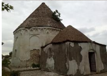
شکل ۳: حفاری باستان‌شناسان در ناتل