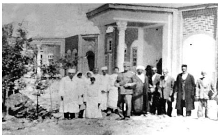
شکل ۸. سپهبد فضل الله زاهدی (نفر وسط دارای یونیفرم نظامی) در بیمارستان زهرا زاهدی دمق اواخر دهه ۲۰

فضل الله زاهدی در قسمتی از نامه به فرزندش اردشیر، در تاریخ سوم آذر ۱۳۳۳ در رابطه با این بیمارستان چنین می نویسد: «... مریضخانه (بیمارستان) زهر/ زاهدی در دمق خیلی خوب شده، آن ها که دیدند گفتند در همدان به این خوبی مریضخانه نیست، اتفاقاً یک دکتر بسیار خوب پیدا کردم که اهالی خیلی از او راضی هستند. امسال از ۵ ماه پیش، ۶ هزار مریض معالجه شده. مردم خیلی راضی هستند، اما خیلی هم خرج کرده ام. برای بیمارستان چراغ برق، یخچال، حتی رادیو فرستاده ام. به قدر پنج، شش هزار تومان دیگر خرج دارد که بهترین بیمارستان شود...» [۱۷].